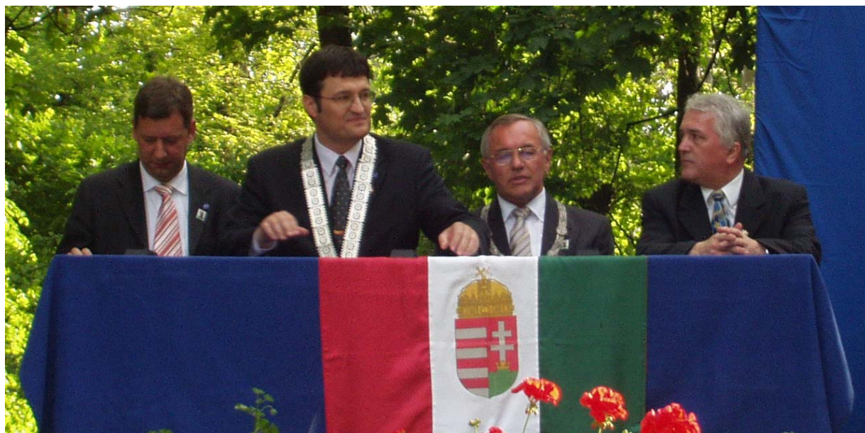
Von links nach rechts: Die Bürgermeister von Heumen (Holland), Csorna (Ungarn) und Sinzing sowie ein Vertreter der Regierung aus Budapest